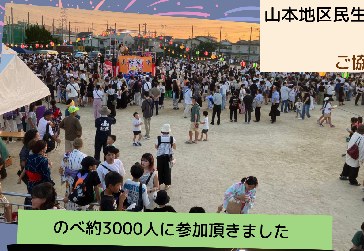
のべ約3000人に参加頂きました