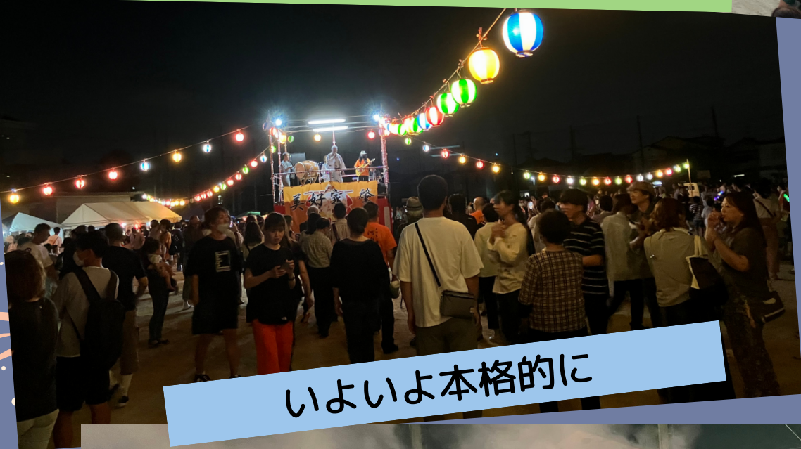
いよいよ本格的に