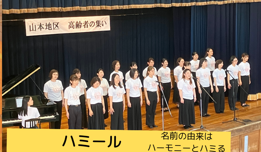
ハミール 名前の由来はハーモニーとハミる