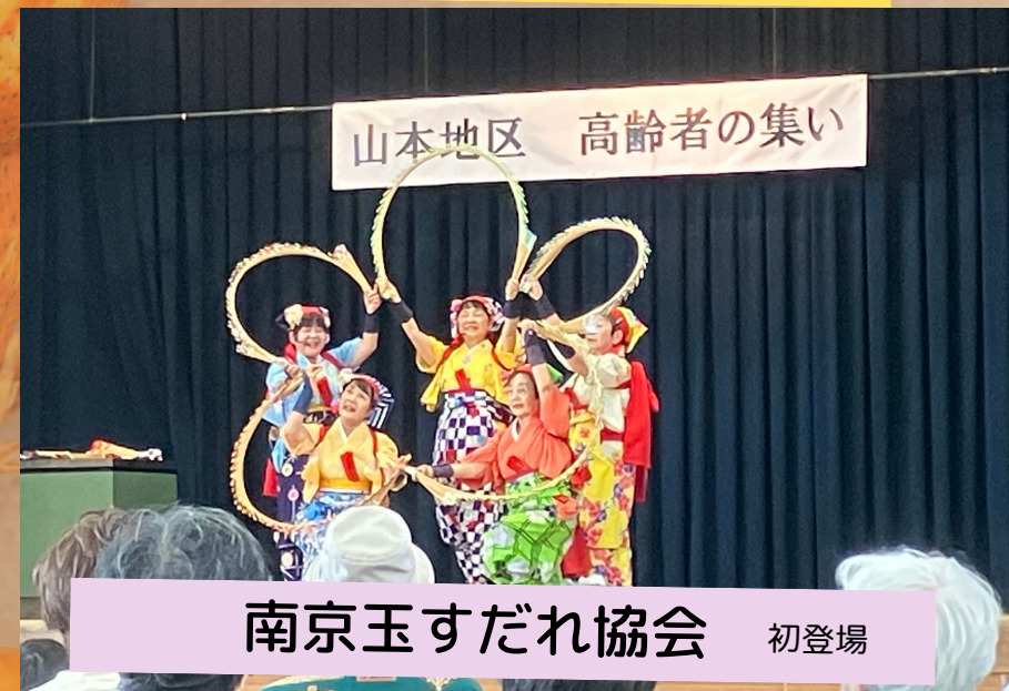
南京玉すだれ協会 初登場