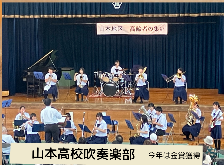
山本高校吹奏楽部 今年金賞獲得

今年は初の南京玉すだれ協会の方々をお招きして数々の技を御披露頂きました。高齢者だと思えば誰でも参加できる会と言うことで、小さいお孫さんと一緒に参加されている方も見受けられました。とても年齢層が広い会となりました。何歳でも参加可能なので皆さんどんどんご参加下さい。