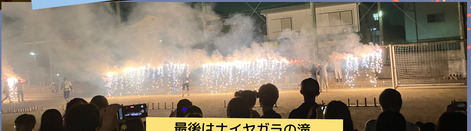
最後はナイヤガラ滝