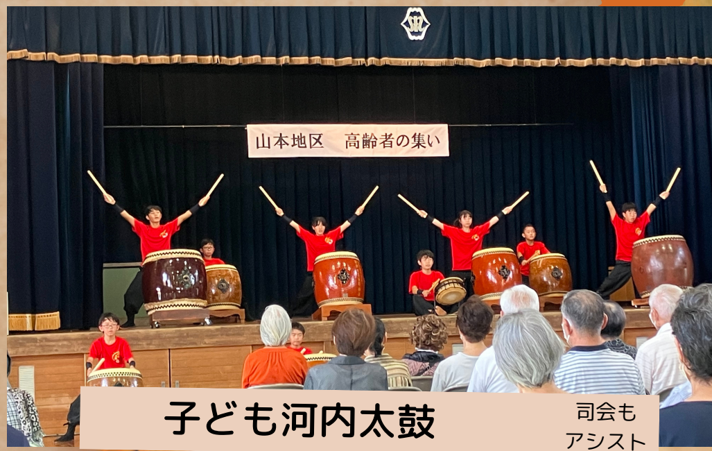
子ども河内太鼓 司会もアシスト